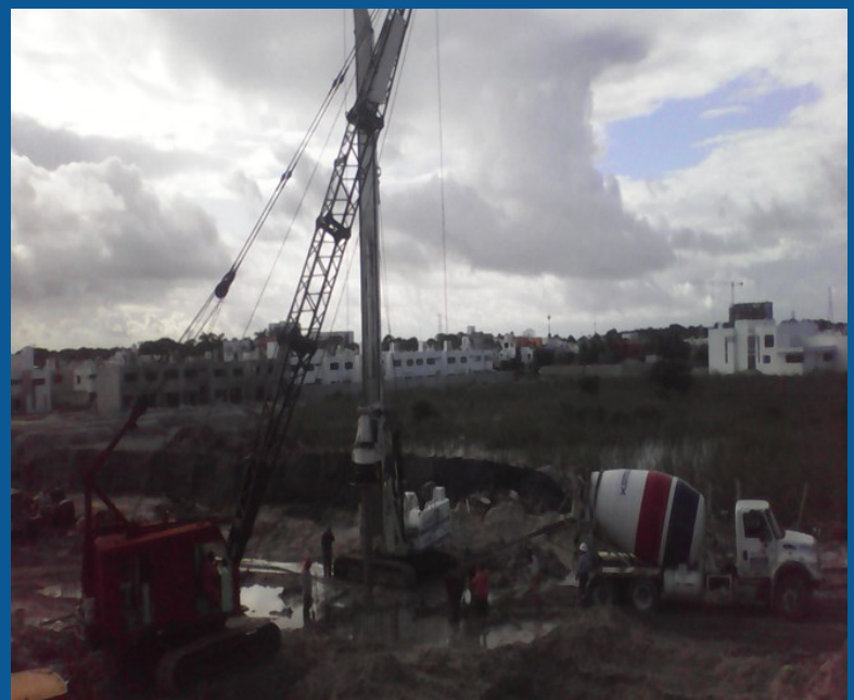
Colado de pilas