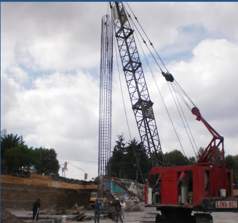
Colocación de acero