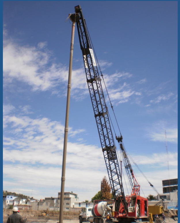
Colocación de tubería tremie

La estratigrafía se puede describir de la siguiente forma: Superficialmente de 0.00 a 0.60 m se tiene materia orgánica, de ahí hasta los 4.00 m un estrato de arena limosa con betas arcillosas muy estratificadas de tamaño máximo 1" tipo SM color gris oscuro de baja compresibilidad, de compacidad relativa suelta, continua de 4.00 a 14.00 m un estrato de arena limosa con betas arcillosas estratificada con tamaño máximo de 1/2" tipo SM, color gris oscuro, de baja compresibilidad, de compacidad relativa suelta, con contenidos de agua altos y por ultimo se encontró de 14.00 a 20.40 m un estrato de arena arcillosa tipo SC color café claro, de mediana compresibilidad, de consistencia muy compacta. El nivel de aguas freáticas se localizo a 14.40 m.