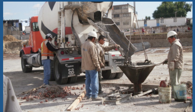
Colocación de concreto