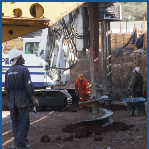
Perforación con broca