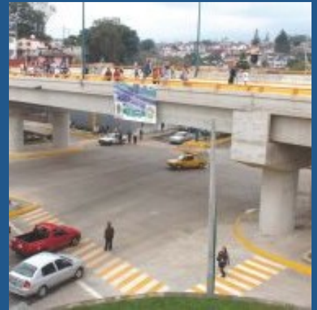
Vista lateral del puente

Cuarta unidad. Subyaciendo a los suelos de la unidad anterior y hasta la máxima profundidad explorada de 23 m, la cuarta unidad estratigráfica está constituida por una intercalación de arcilla poco arenosa de baja plasticidad y arena arcillosa, de consistencia dura y compacidad muy densa, respectivamente.