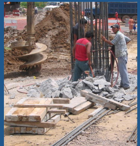
Colocación del armado