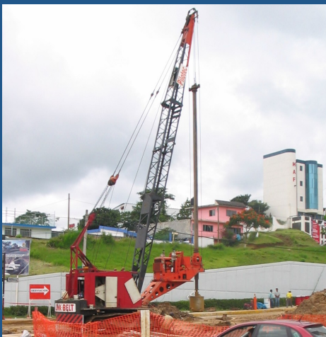
Perforación para pilas