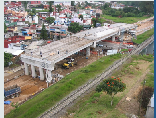
Vista aérea del puente Murillo

En el edificio "Los Toritos", tomando en cuenta que los puntos de los apoyos de la nueva edificación no cuentan con los accesos para los equipos de pilas, se utilizaron micropilotes.