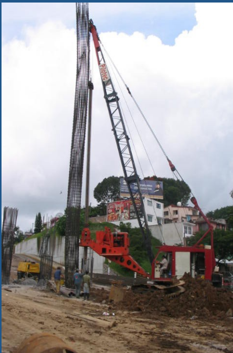
Izaje de armado para pila.