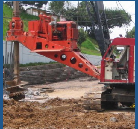
Perforación para pilas