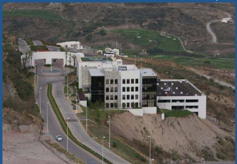
Edificio de estacionamiento