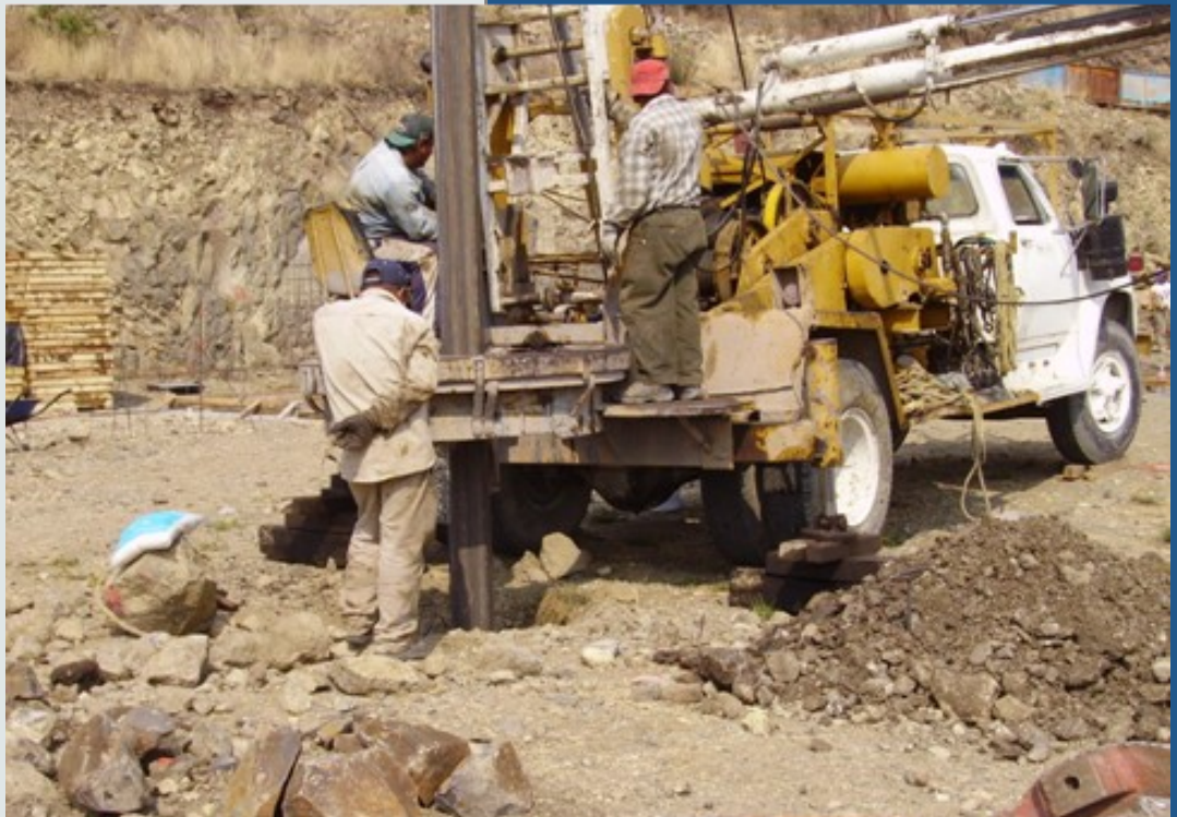
Perforación de pilas