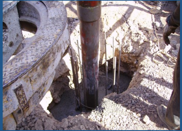
Colado de pilas

Además se realizaron pilas para el departamento de dos niveles cimentado con 15 pilas rectas de 60 cm de diámetro y 8 m de profundidad promedio. Para éste último, la estratigrafía estaba conformada con relleno con filtro, subyaciendo el primero, se localizó arcilla con boleas, finalmente por roca.