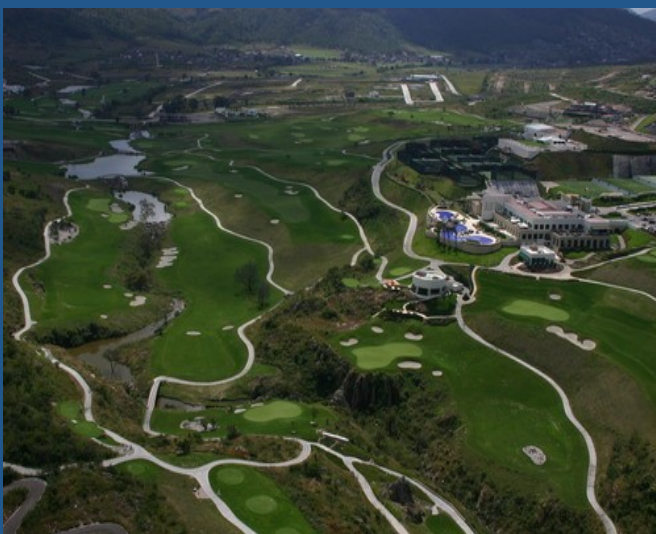
Ciudad tres marías